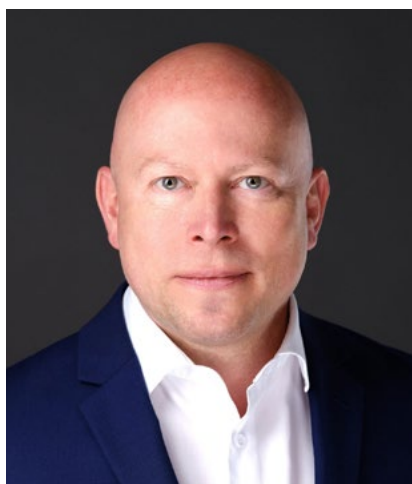
Stéphane Pallage Recteur

comment l'UQAM peut-elle mieux servir le Québec. Le résultat est un plan ambitieux pour l'Université, qui s'apprête à vivre de grands développements au bénéfice du Québec.