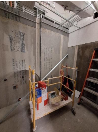
Travaux, toilette inclusive, Pav V, niv R.