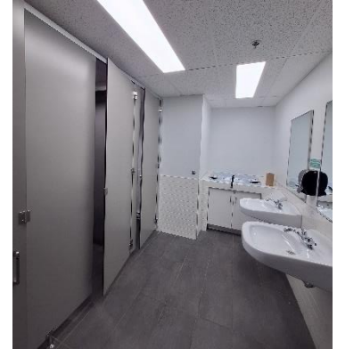
Toilette inclusive au pavillon AB