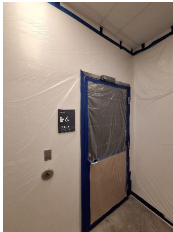
Toilette inclusive au pavillon C, chantier presque terminé.