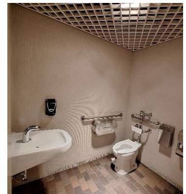
Toilette inclusive au pavillon A