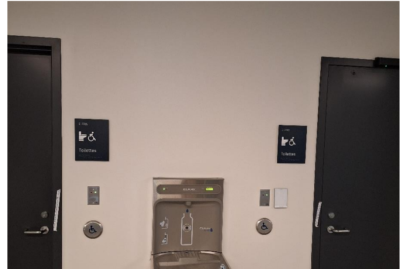
Application nouvelle signalétique , pav C